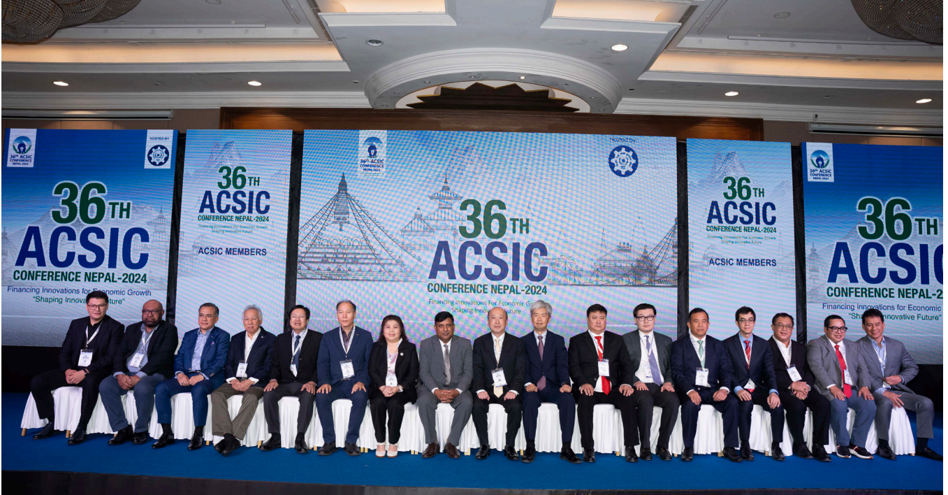
कोषको आयोजनामा काठमाडौंमा भएको ३६ औं ACSIC सम्मेलन