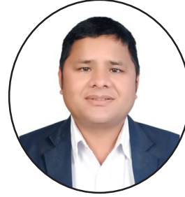
अर्जुन ठाणुना शाखा कार्यालय, धनगढी