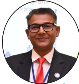
नबीन मर्दरई नायव प्रबन्धक योजना, अनुसन्धान तथा जास्विम व्यवस्थापन विभाग