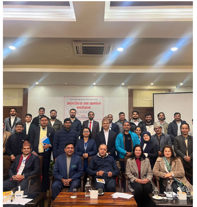
कर्जा सुरक्षण सम्बन्धी गोष्ठी