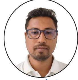
बसन्त के.सी. शाखा कार्यालय, बुटवल