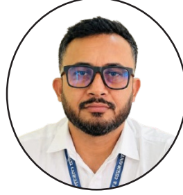
पुर्ण बहादुर खड्का शाखा कार्यालय, बिराटनगर