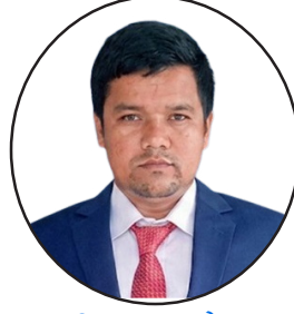
जीवन सापकोटा शाखा कार्यालय, पोखरा