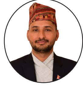
कृष्ण बराल शाखा कार्यालय, जनकपुर