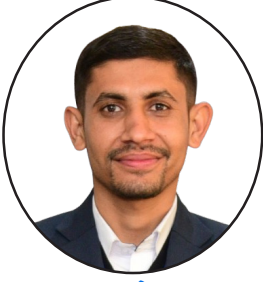
पुष्कर कोइराला शाखा कार्यालय, भरतपुर