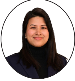
रुची श्रेष्ठ मुख्य शाखा कार्यालय, काठमाडौं