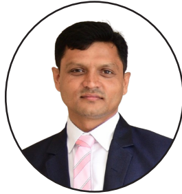
चोलाकान्त सुवेदी शाखा कार्यालय, सुर्खेत