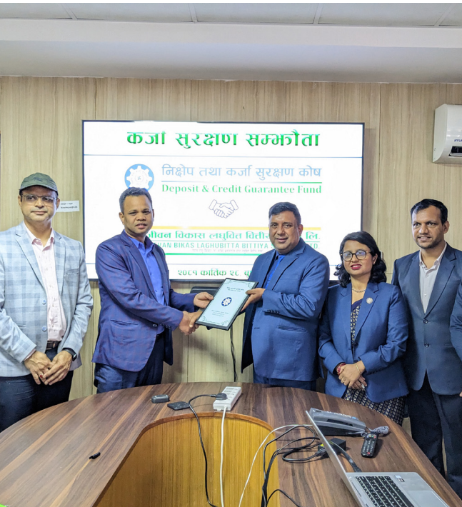
कर्जा सुरक्षण सम्झौता