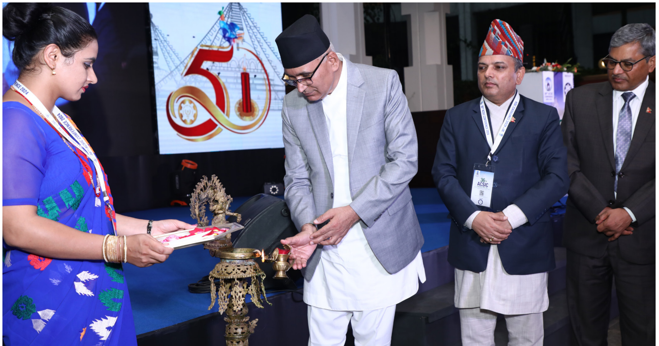
कोषको ५१ औं वार्षिकोत्सव कार्यक्रम