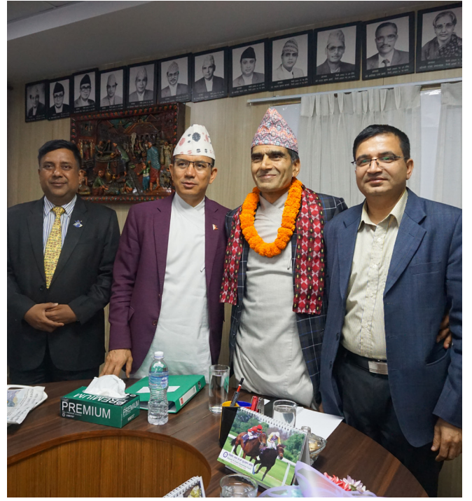
संचालक समिति अध्यक्षको स्वागत