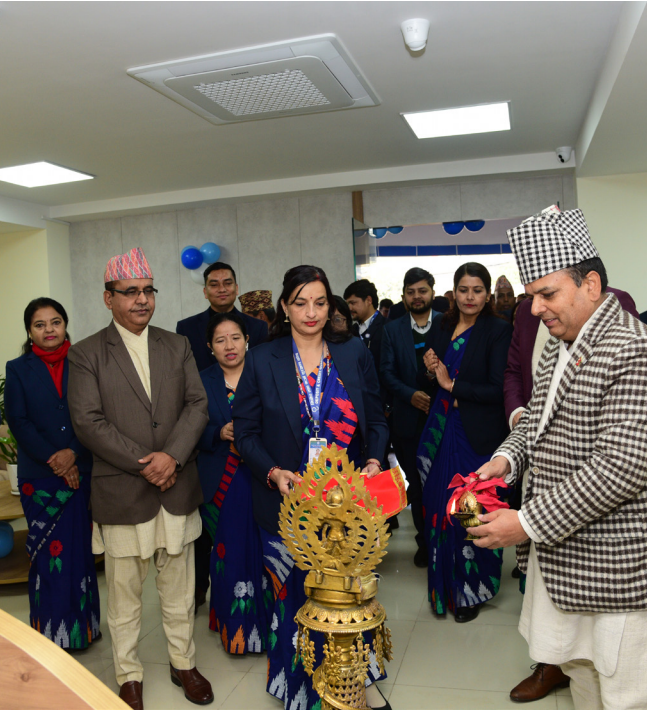
मुख्य शाखा कार्यालय, काठमाडौंको उद्घाटन